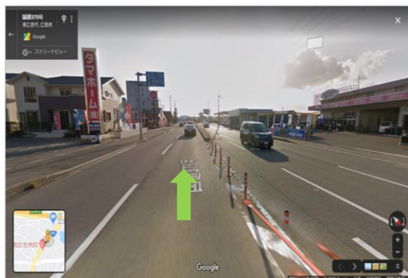
② 道なりにすすむ (約 500m)