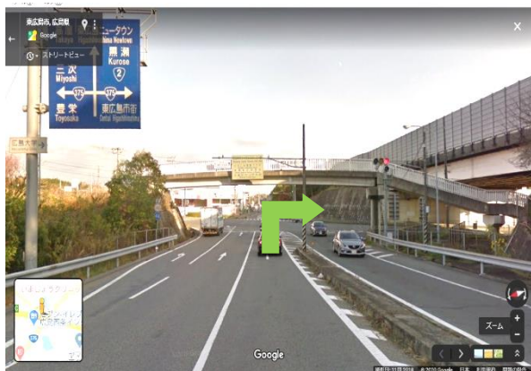
① 西条 IC 出口の交差点を右折する