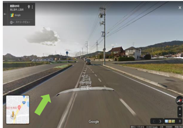
④ 道なりにすすむ (約 1.4 km)