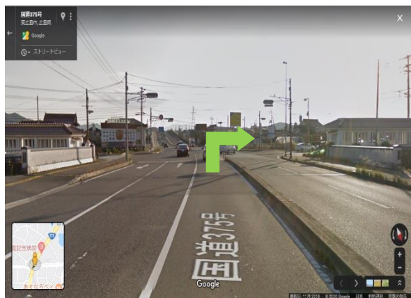
③ 中川交差点を右折する